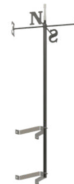
Fixation sur pignon