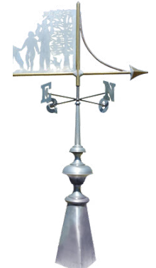
Avec épi de faitage (prix sur demande)