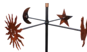
Coq, lune, étoile