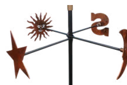
Soleil, lune, étoile